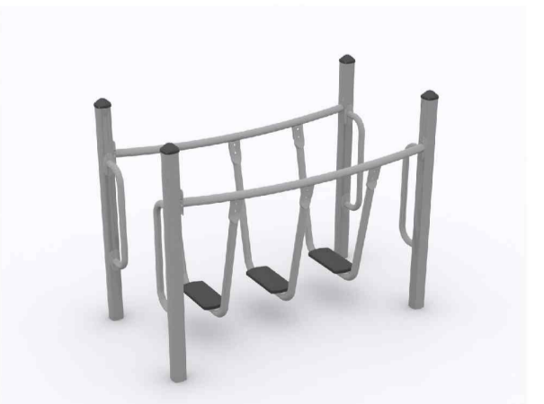
UUSI LEIKKIVÄLINE TASAPAINOILUUN