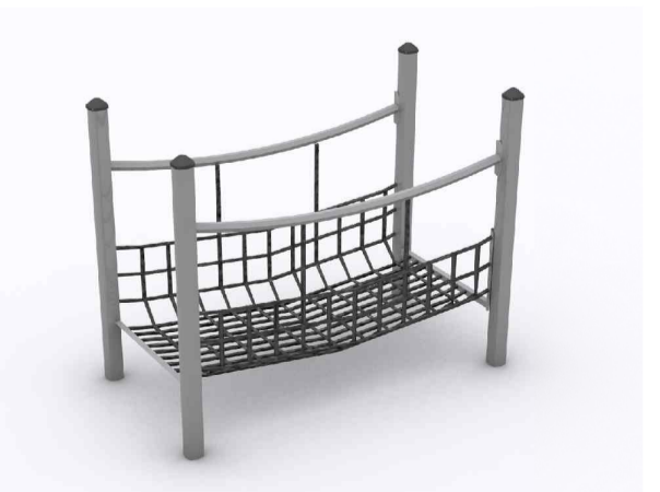
UUSI LEIKKIVÄLINE TASAPAINOILUUN